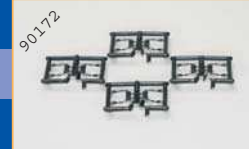
90172 Spiegelsatz/DAF XF 105 - schwarz (4 Satz) EUR 4,90*