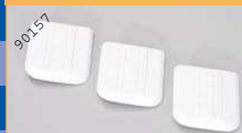
90157 Klima-Anlage/MB Tourismo - weiß (3 Stück) EUR 4,90*