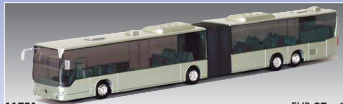
11791 MB CapaCity 2008 - ohne Beschriftg.