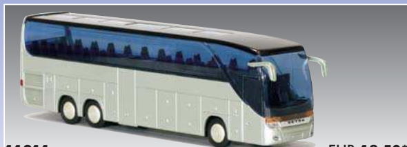
11211 SETRA S 416 HDH/Glasd. - ohne Beschriftg.