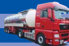
8163.51 MAN TGX XLX - (H)Tank-SZ »Siepmann«