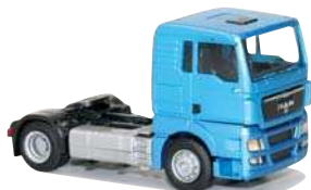
8019.01 MAN TGX XL -Zugmaschine EUR 11,50*