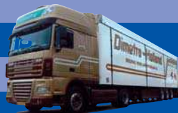
7894.51 EUR 24,50* DAF XF 105 SSC/Aerop. - Schubboden-SZ »Dimetra«