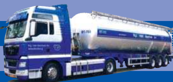
8096.01 MAN TGX XXL/Aerop. - Kippсило-SZ »Van Bentum«