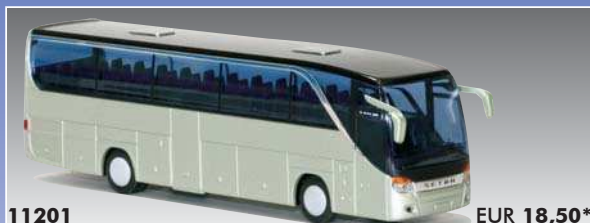
11201 SETRA S 415 HD/FL - ohne Beschriftg.