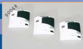
90048 Kühlaggregat Thermoking SL 200e (3 Stück) EUR 4,90*