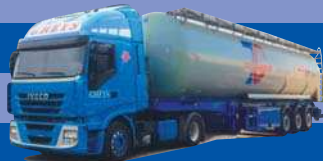
7976.01 EUR 24,50* Iveco Stralis II/Aerop. - Kippsilo-SZ »Gheys«