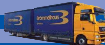
8038.71 EUR 27,--* MAN TGX XXL - G-KTazH »Brömmelhaus«