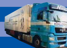
8041.01 EUR 24,50* MAN TGX XXL/Aerop. - Kühl-KSZ »Nitz«