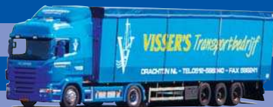
7794.51 EUR 24,50* Scania Highl./Aerop. - Schubboden-SZ »Visser's«