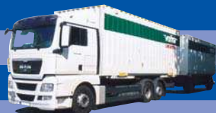
8015.01 EUR 27,--* MAN TGX XL - CBHZ »Vehar«