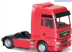
8049.01 MAN TGX XXL/Aerop. -Zugmaschine EUR 11,50*