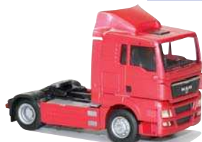
8029.01 MAN TGX XL/Aerop. -Zugmaschine EUR 11,50*