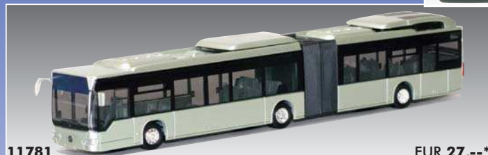
11781 MB Citaro G/Hybrid - ohne Beschriftg.