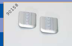
90158 Klima-Anlage/MB Tourismo - silber (2 Stück) EUR 4,90*