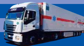
7911.01 EUR 24,50* Iveco Stralis II - Kühl-KSZ »Corsi«