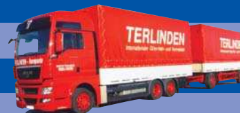
8034.01 EUR 27,--* MAN TGX XXL - PrHZ »Terlinden«