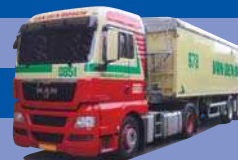
8164.01 MAN TGX XLX - Kipp-SZ »Van den Bosch«