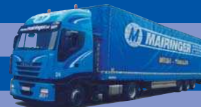
7913.01 EUR 24,50* Iveco Stralis II - PrZ »Mairinger«