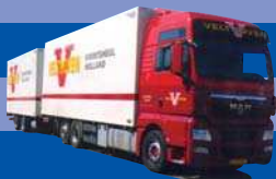
8081.01 MAN TGX XXL - Kühl-KTαHΖ »Velthoven«