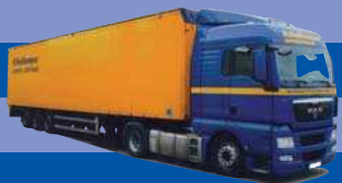
8174.51 EUR 24,50* MAN TGX XLX/Aerop. - Schubboden-SZ »Heitkemper«