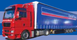
8092.01 MAN TGX XXL/Aerop. - G-KSZ »Rose«