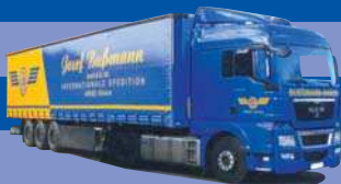
8172.01 EUR 24,50* MAN TGX XLX/Aerop. - G-KSZ »Bußmann«