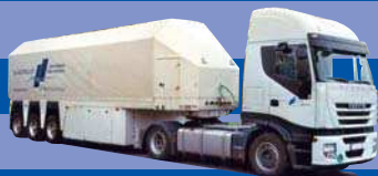
7968.01 EUR 24,50* Iveco Stralis II - Innenlader-SZ »Glasziegler«