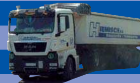
8064.11 EUR 24,50* MAN TGX XL - Eckmulden-SZ »Hiemisch«