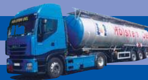
7963.51 EUR 24,50* Iveco Stralis II - (H)Tank-SZ »Holsten Oil«