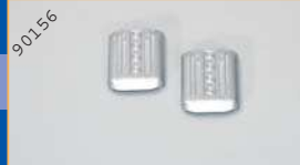
90156 Klima-Anlage/MB CapaCity - silber (2 Stück) EUR 4,90*