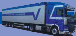
7874.51 EUR 24,50* DAF XF 105 SC/Aerop. - Schubboden-SZ »Van Vlastuin«