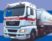
8164.11 MAN TGX XLX - Eckmulden-SZ »Giesker -Laakmann «