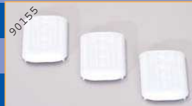
90155 Klima-Anlage/MB CapaCity - weiß (3 Stück) EUR 4,90*