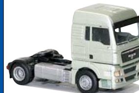
8119.01 MAN TGX XLX -Zugmaschine EUR 11,50*