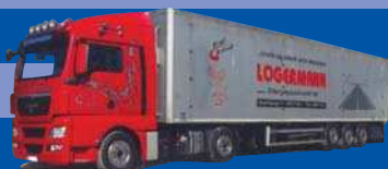
8174.52 EUR 24,50* MAN TGX XLX/Aerop. - Schubboden-SZ »Logermann«