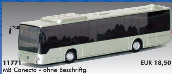
11771 MB Conecto - ohne Beschriftg.

Im Jahr 2008 wurden fünf neue Busmodelle für die Industrie und das AWM-Programm entwickelt. Damit wächst die AWM-Bus-Dauer-Serie auf 34 Grundmodelle. Weitere interessante Entwicklungen sind bereits in Arbeit.