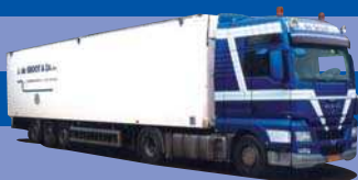
8094.51 MAN TGX XXL/Aerop. - Schubboden-SZ »De Groot«